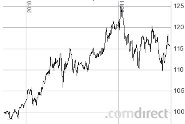
TAC Fund – The Asian Century