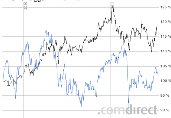
TAC Fund ggü. Nikkei 225