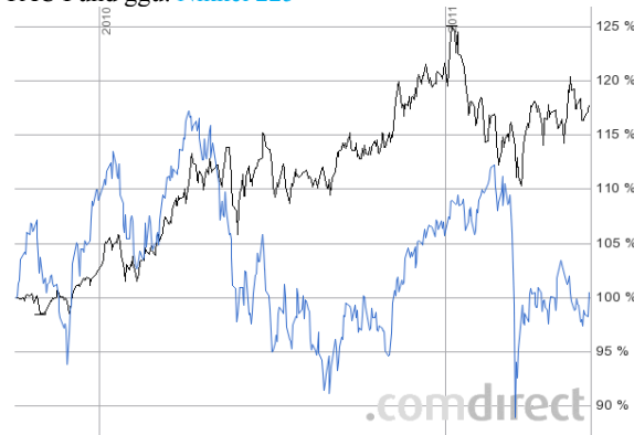
TAC Fund ggü. Nikkei 225