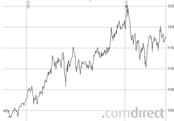
TAC Fund – The Asian Century