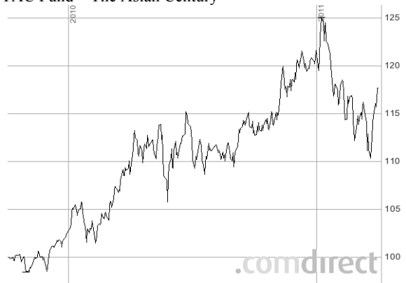
TAC Fund – The Asian Century