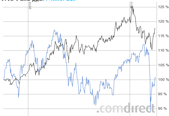
TAC Fund ggü. Nikkei 225